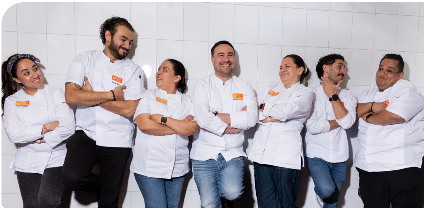
Equipo de Chefs UFS MÉXICO

Entendemos que estás adaptándote a procesos que te ayuden a superar los desafíos actuales, y preocupaciones como, menús innovadores, reducción de costos, inflación, eficiencia operativa, sustentabilidad, entre otros. En todo esto, Unilever Food Solutions te puede ayudar.